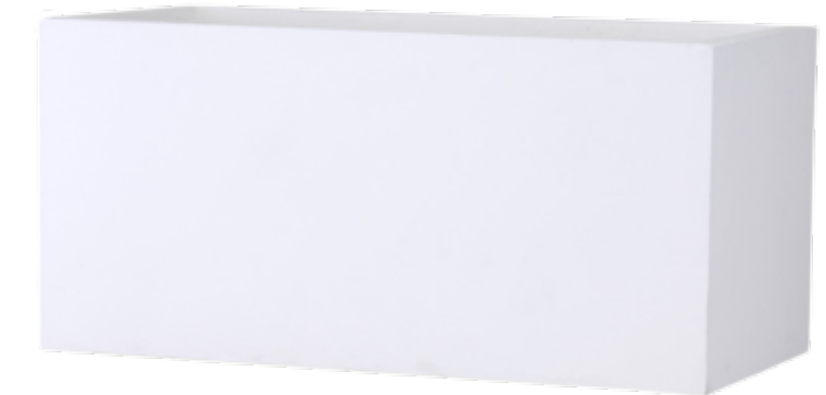
バスケットプランター L59W30H30