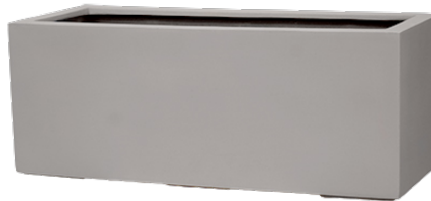
キンロスベージュ L60W20H20