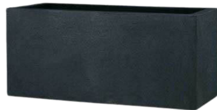
キンロスブラック L60W20H20